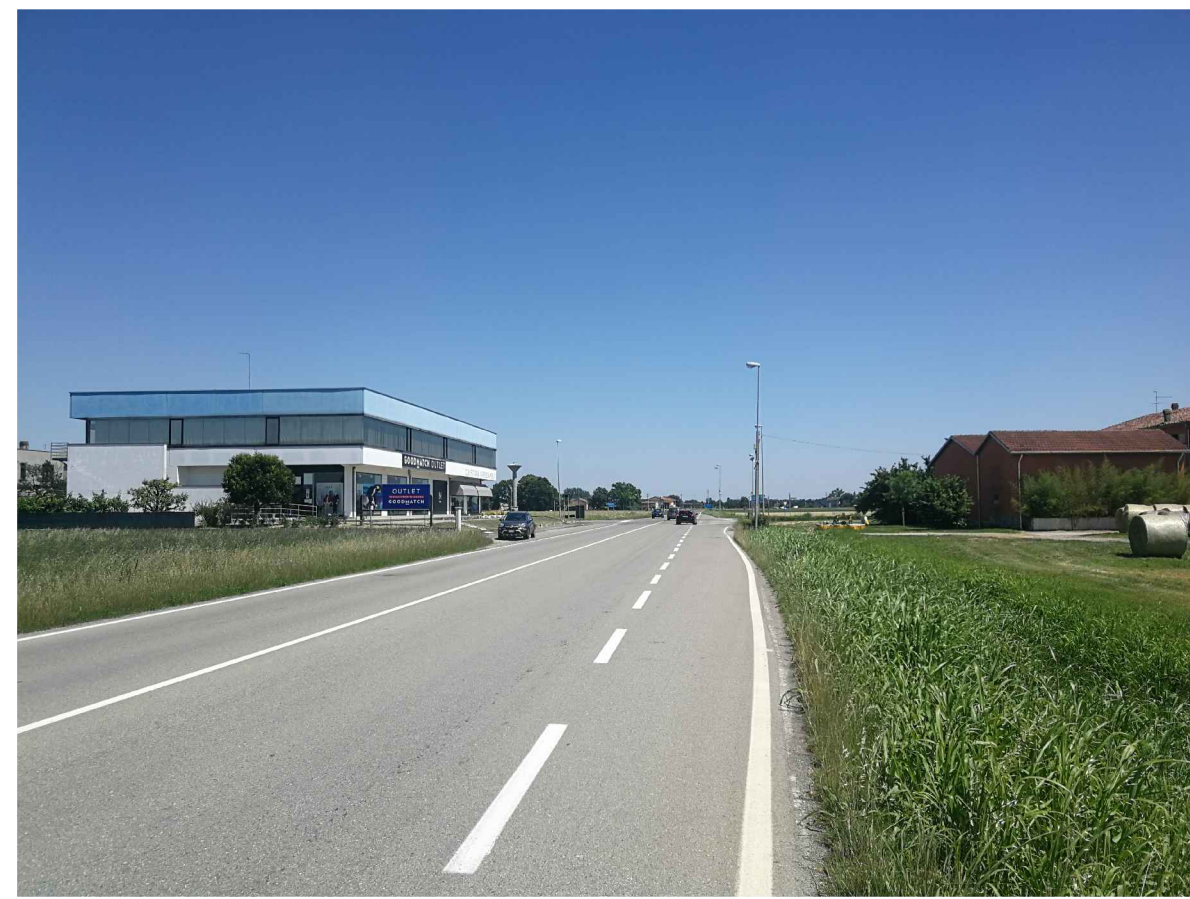
F.01 vista da SP10