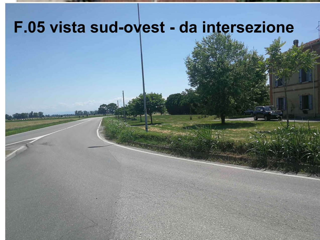
F.05 vista sud-ovest - da intersezione