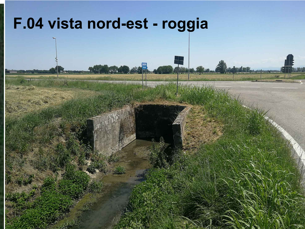
F.04 vista nord-est - roggia