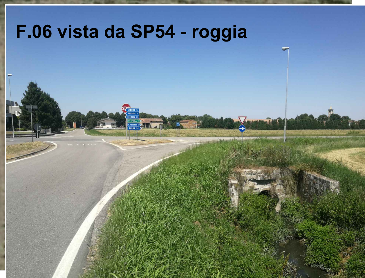
F.06 vista da SP54 - roggia