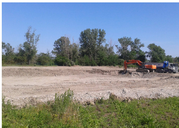
Cava di Ghiaia – Molino di Mezzo (Traversetolo)

Per quanto riguarda invece le ghiaie pregiate, considerando l'intera previsione estrattiva del PIAE (poli estrattivi, ambiti comunali vincolati e interventi idraulici art.17bis) pari a circa 17.365.000 mc, si evince che il quantitativo pianificato dai PAE comunali è di circa 15.160.000 mc (di cui la metà già autorizzata e l'altra metà da autorizzare) e la restante quota di circa 2.205.000 mc ancora da pianificare.