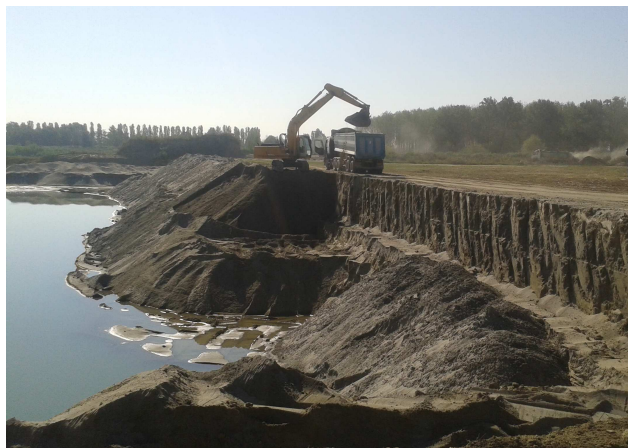
Cava di Sabbia Bosco della Lite (Polesine Zibello)

Infatti, preso atto degli scenari socio-economici e territoriali attuali, profondamente diversi da quelli utilizzati da riferimento per gli obiettivi e previsioni del PIAE vigente, si è ritenuto opportuno provvedere alla verifica dei contenuti del piano in relazione alle previsioni e alla effettiva attuazione di queste in ragione della futura previsione di fabbisogni di materiale nel territorio provinciale.