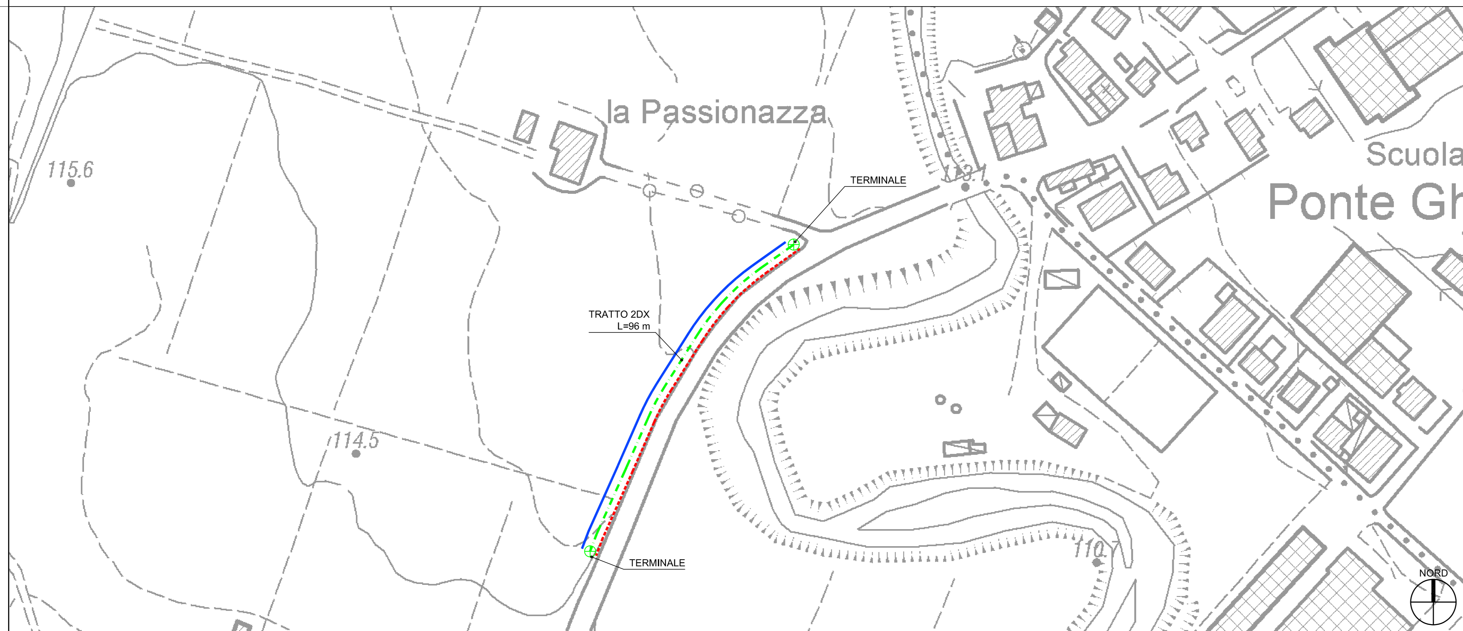
PONTE GHIARA INTERVENTO N.2