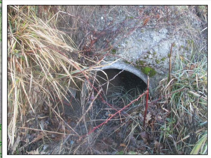
ATTRAVERSAMENTO STRADALE 3 - USCITA

Tipolog.: Tubo di Geometrica: Ø500 mm Lunghezza: 1000 cm Copertura: 50 cm Pozzetti salto di quota: N.1 80x80x100 circa ATTRAVERSAMENTO STRADALE 3