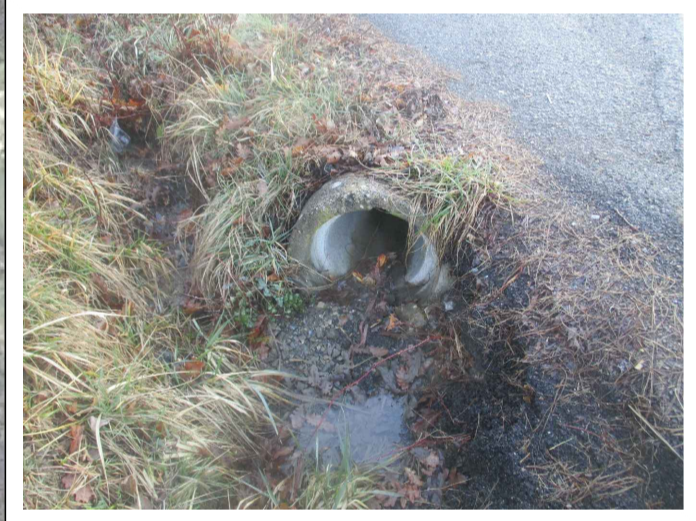
ATTRAVERSAMENTO STRADALE 2 - INGRESSO

Tipolog.: Tubo di Geometrica: Ø300 mm Lunghezza: 450 cm Copertura: 20 cm Pozzetti salto di quota: N.1 80x80x100 circa ATTRAVERSAMENTO STRADALE 2