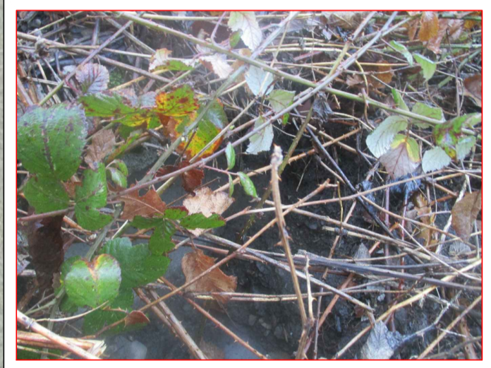
ATTRAVERSAMENTO STRADALE 1 - INGRESSO