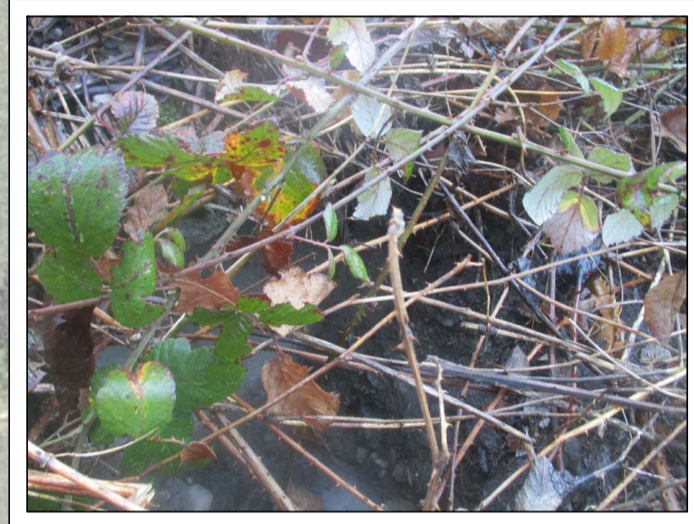
ATTRAVERSAMENTO STRADALE 1 - USCITA

Tipolog.: Chivico in pietra Geometrica: 40x40 cm Lunghezza: 750 cm Copertura: 40 cm Pozzetti salto di quota: N.1 40x80x100 circa ATTRAVERSAMENTO STRADALE 1